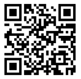
港社協 ホームページ