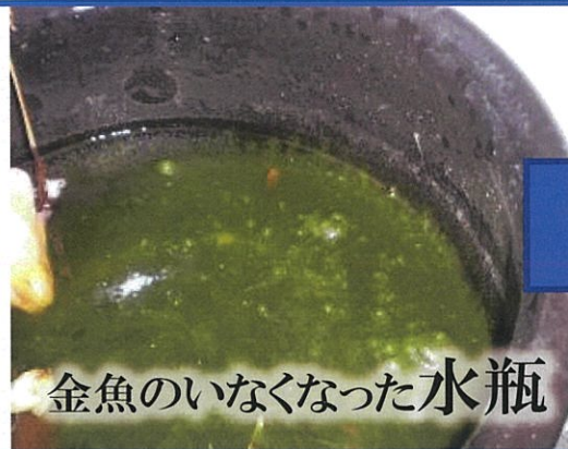
金魚のいなくなった水瓶