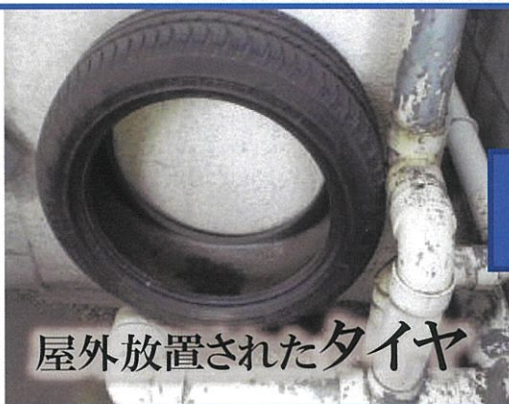
屋外放置されたタイヤ