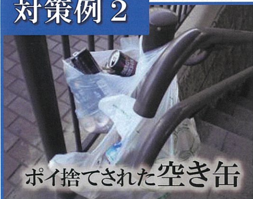
ポイ捨てされた空き缶