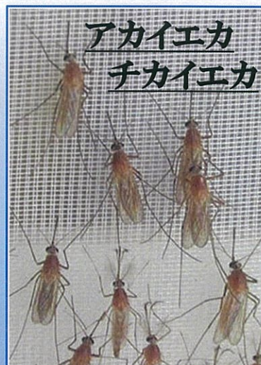
アカイエカ チカイエカ