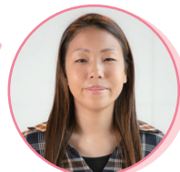
たかだち あきみ パラ陸上 高田 千明

アテネ、北京、ロンドン五輪に3大会連続出場を果たす。アテネ五輪では日本選手団の旗手を務める。またアテネ、北京五輪では銅メダルを獲得。