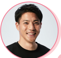
やまがた りょうた 陸上 山縣 亮太

リオデジャネイロ2016五輪4×100mリレーでは第一走者として銀メダル獲得。東京2020五輪では日本選手団主将を務める。