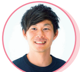
はせがわ だいご 陸上 長谷川 大悟

1975年静岡県浜松市生まれ。15歳で全盲となる。パラリンピックにはバルセロナ(1992)からロンドン(2012)まで水泳日本代表として、6大会に連続出場、金5を含む21個のメダルを獲得し、日本人初のパラリンピック殿堂入り。東京2020パラリンピック競技大会日本代表選手団団長。