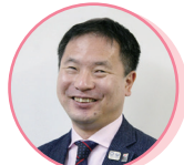
かわい じゅんいち 日本パラリンピック委員会 委員長 河合 純一

リオデジャネイロ2016パラリンピックでは8位入賞。東京2020パラリンピックでは5位入賞。